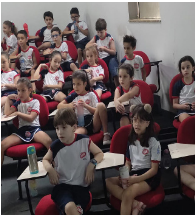
Alunos participando do encerramento